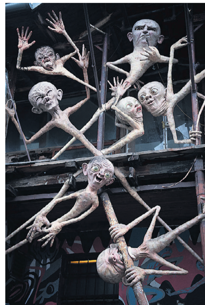
Kreativiteten har fået frit spil.

staden Ljubljana, ved Bled-søen eller ved Postojna-hulen. Den er besøg værd.