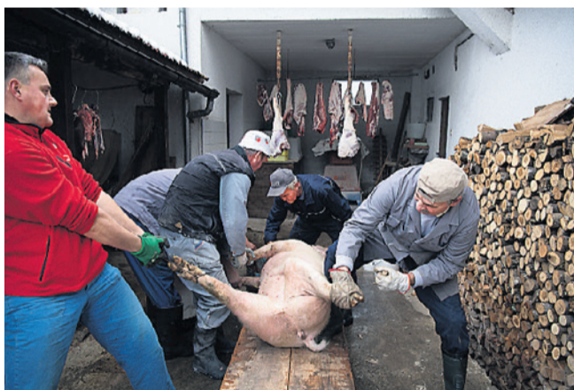
Hjemmeslagtning hos familien Bahor.