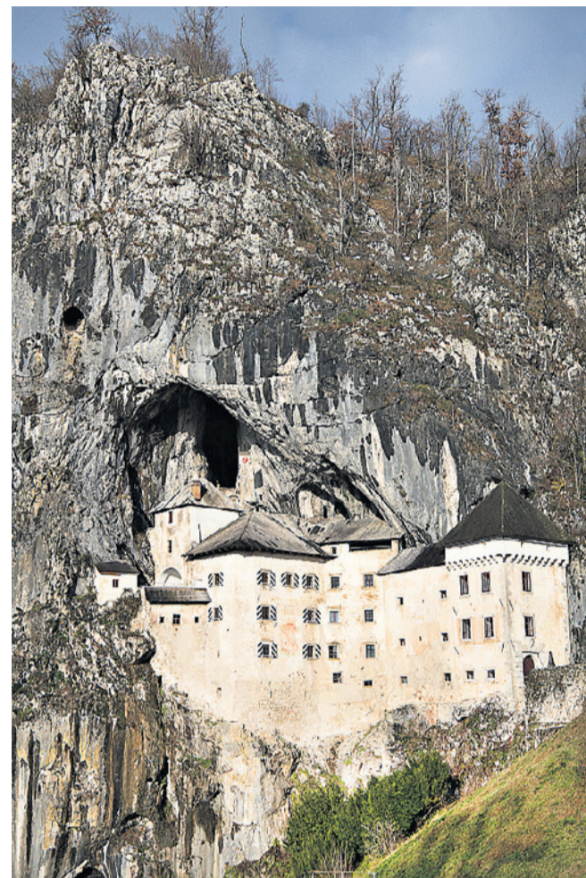
Predjama Slot er nærmest vokset sammen med kalkstensklipperne.