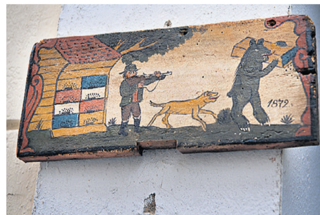
Indflyvningsmaleri fra gammelt bistade i byen Radovljica.