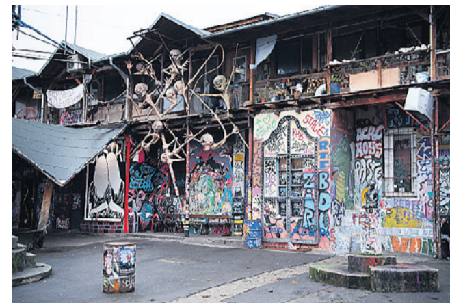
Det alternative kvarter Metalkova, hvor der i dag er fyldt med graffiti og en god stemning af undergrund med en masse anderledes street art.