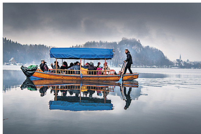
Øen og kirken kan besøges med nogle små træbåde.