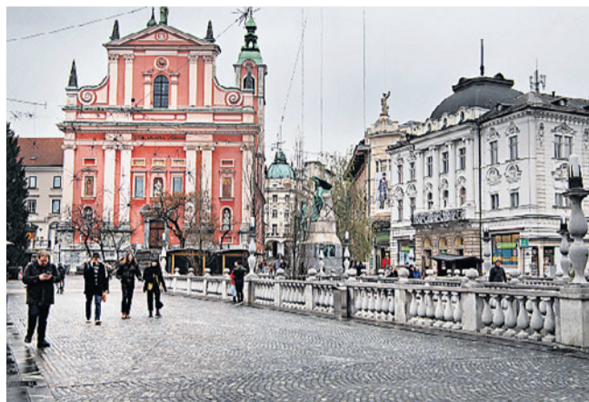
Ljubljanas arkitektur er præget af barok, jugendstil og den lokale arkitekt Jože Plečnik, som står bag den centrale bro i centrum.