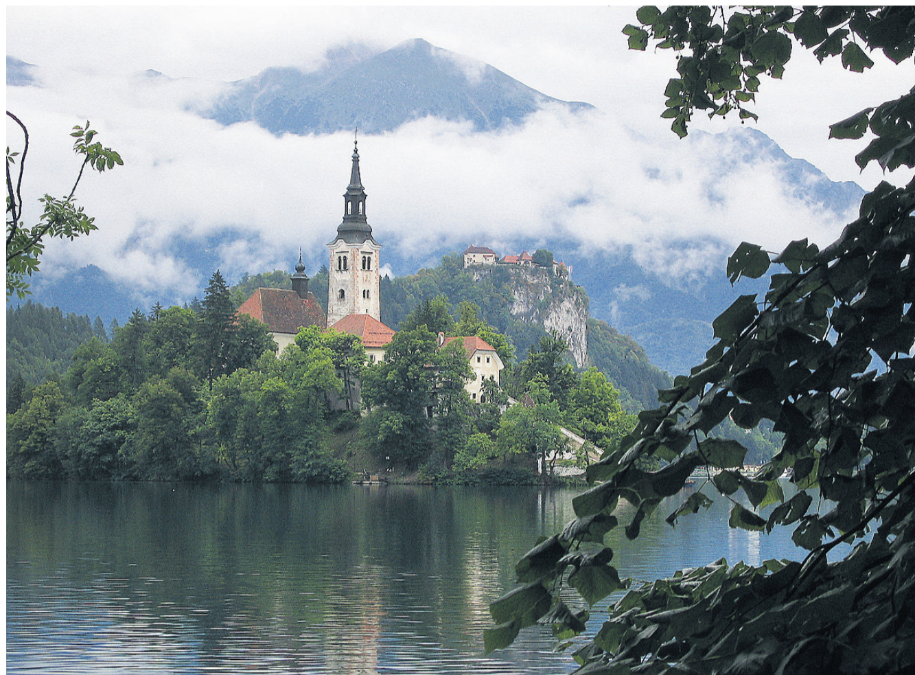
Barokkirken på øen i Bled søen.

Det lille land øverst på Balkan er en af Europas bedst bevarede rejsehemmeligheder