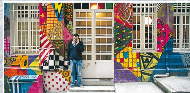
Istanbuls små gader