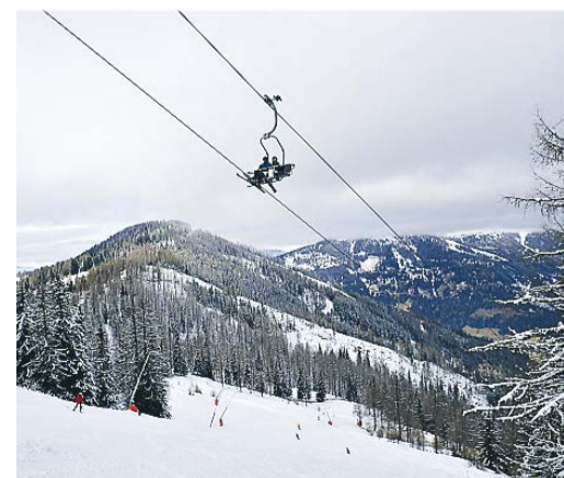
25 moderne liftanlæg giver en hurtig betjening og der er ofte god plads på pisterne gemmen skoven.