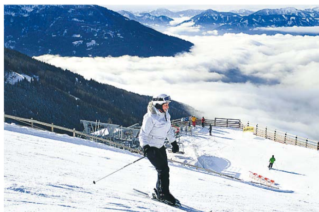
Bad Kleinkirchheim/St. Oswald har meget velpræparerede pister og der er god plads.