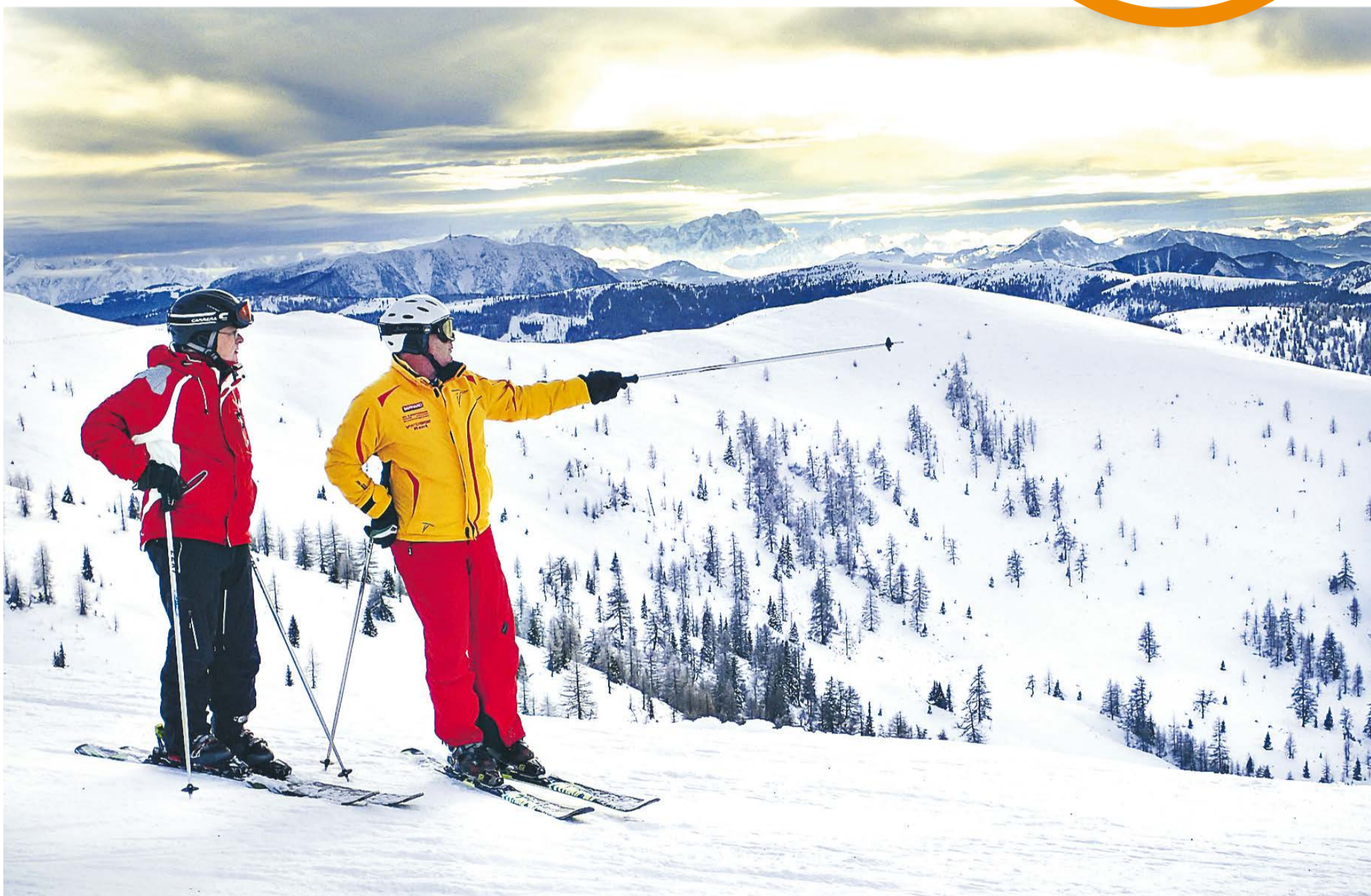
Udsigten fra toppen af Kaiserburg i 2055 meter højde nydes inden turen igen går ned mod byen

Østrigske Bad Kleinkirchheim formår på fornemste vis at kombinere verdensklasse skiløb med wellness og termiske kilder