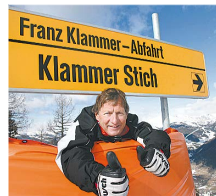
Franz Klammer på 61 har stadig tilknytning til området og stiller gerne op til skiløb, fotos og autografer.