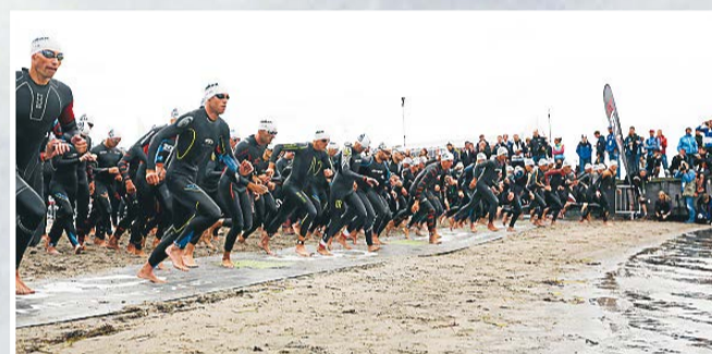
Vil du prøve en ironman?