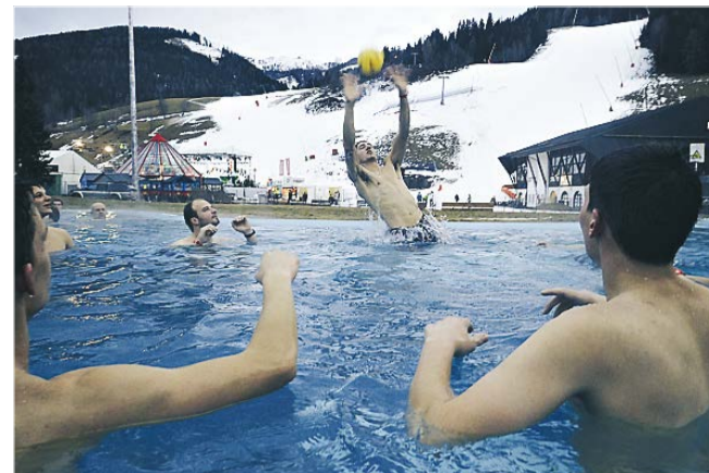
Foto: Michael Gruber Thermal Römerbad for enden af pisterne er med til at gøre skiferien helt speciel.

Tekst og foto: Hans Ravn hans.ravn@nordjyske.dk