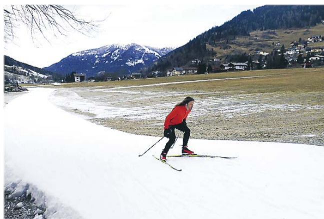
Selvom der i januar var faldet meget lidt sne i bunden af dalen, var der udlagt en langrendsløje på over fire km.